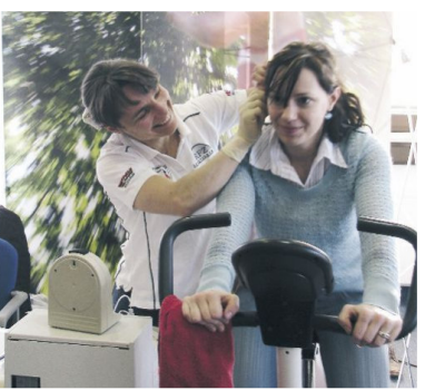
Bereits zum siebten Mal findet in diesem Jahr der Präventionstag im Regensburger Gewerbepark statt.